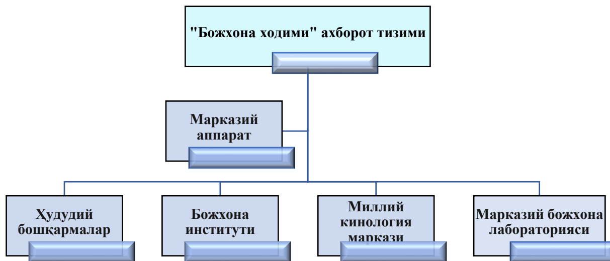
3-расм. “Божхона ходими” ахборот тизимидаги маълумотларнинг шаклланиши

Қайд этиш лозимки, божхона органларида инсон ресурсларини бошқариш йўналишини рақамлаштириш орқали бир қатор ижобий натижаларга эришилди.