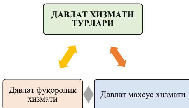
1-расм. Давлат хизмати турлари

Ўзбекистон Республикаси қонунчилигига кўра, давлат хизмати иккига бўлинади (1-расм): давлат фуқаролик хизмати ва давлатнинг махсус хизмати.